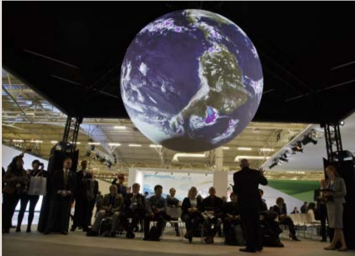
Man skulle gjerne tro at økt utdanning og mer kunnskap gjorde oss mer klimavennlige. Men nei, det er vår tilhørighet, vår identitet og hvem vi liker å bli likt av, som avgjør hvor klimavennlige vi er, skriver artikkelforfatteren, Her fra «Science on a Sphere Presentation» på the COP21 i Le Bourget, Foto: Michel Euler, AP/NTB Scanpix

Det er krevende å regne hjem kostbare klimatiltak som skal gi oss noe tilbake om 85 år. Satt på spissen kan vi si at med bare to prosent rente er verden anno 2100 verdt en sjettedel av hva