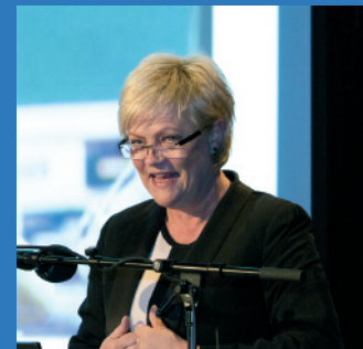
Statsråden åpnet Kunnskapssenteret 16. mai 2013.

I løpet av 2013 har senteret vokst fra én til fem ansatte som samlet ivaretar bredden av Kunnskapssenterets ansvarsområder og oppgaver.